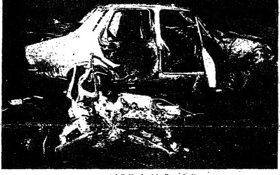
حطام احدى السيارات في مكان الحادث